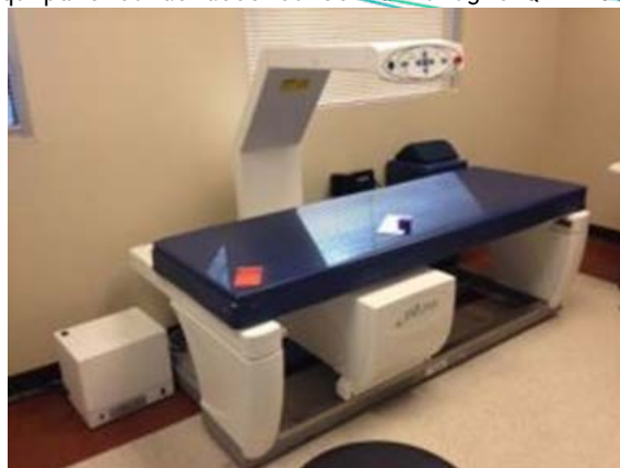
Figura 2 - Equipamento de densitometria Hologic QDR-4500 (fan-beam).