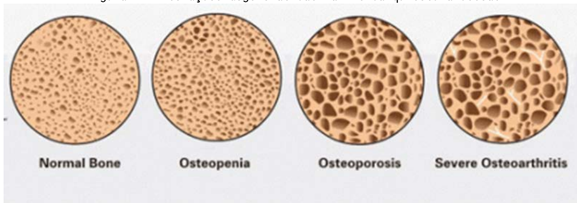
Figura 1- Alterações degenerativas na microarquitetura óssea.

A osteopenia é o estágio inicial da osteoporose, tendo uma lenta perda óssea comparada com a perda que a osteoporose causa, assim não tem decorrência de fraturas de grande porte em decorrência da perda. Apesar de a perda óssea após a menopausa ser maior no osso trabecular, os outros ossos do corpo são acometidos, porém em principal o trabecular que tem uma perda óssea mais avançada em relação aos outros ossos (LANZILLOTTI, 2003; ARAUJO, 2005).