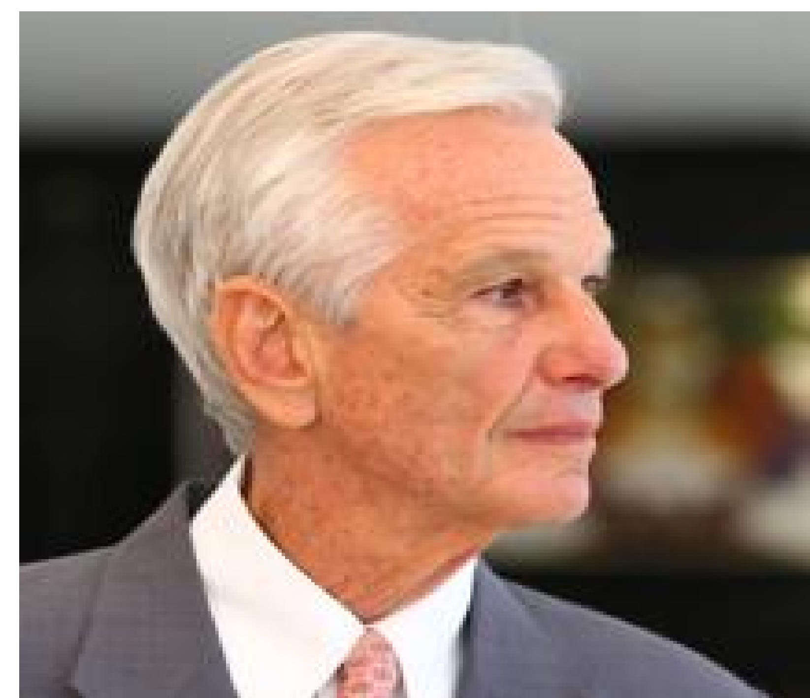
Figura 1 – Jorge Paulo Lemann