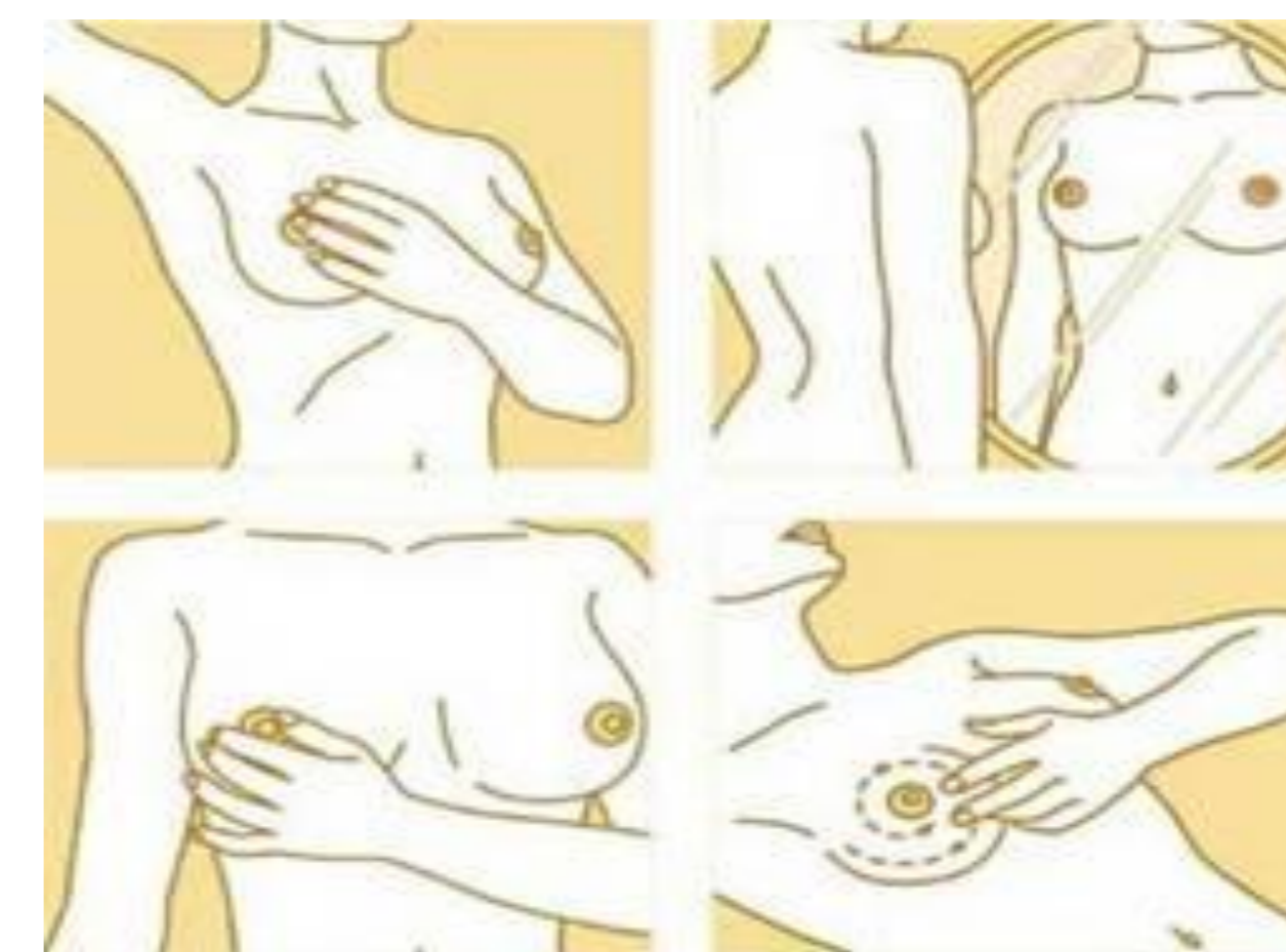
Figura 3: Auto-exame de toque.