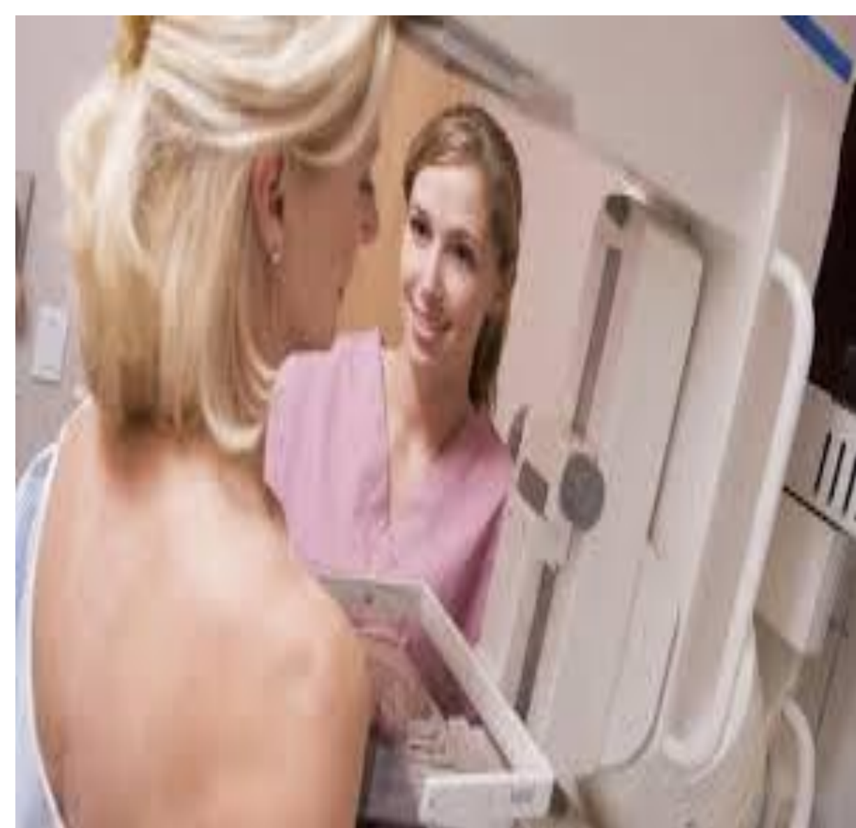
Figura 1: Etapa de um exame de mamografia.

Através da mamografia é possível detectar uma tumoração mamária até dois anos antes que ela se torne palpável (Figura 1). Mesmo assim, numa pequena percentagem de casos, os sinais precoces de câncer podem ser camuflados por um tecido mamário excepcionalmente denso. No entanto mulher com mamas muito firmes ou mamas muito volumosas devem ser orientadas à realização de mamografia digital e ou à ultrassonografia (Figura 2), pois tecidos muito densos ou espessos podem esconder nódulos iniciais. Desta forma outros exames poderão ser indicados, como complemento à mamografia pelo profissional médico. Exames como ultrassonografia, ressonância magnética e tomografia (CHALA & BARROS, 2007).