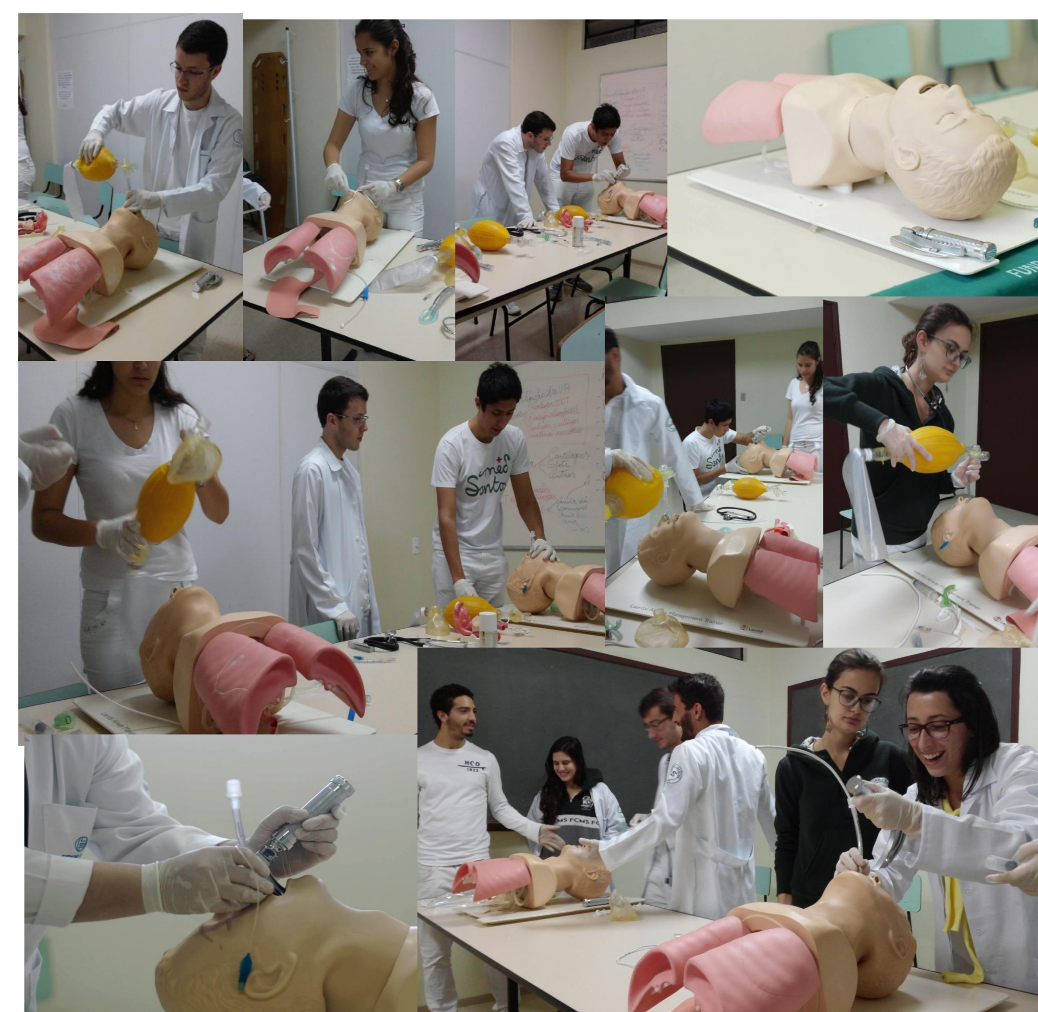
Figura 4 – Estação de Habilidades de Permeabilização de Vias Aéreas / HP II