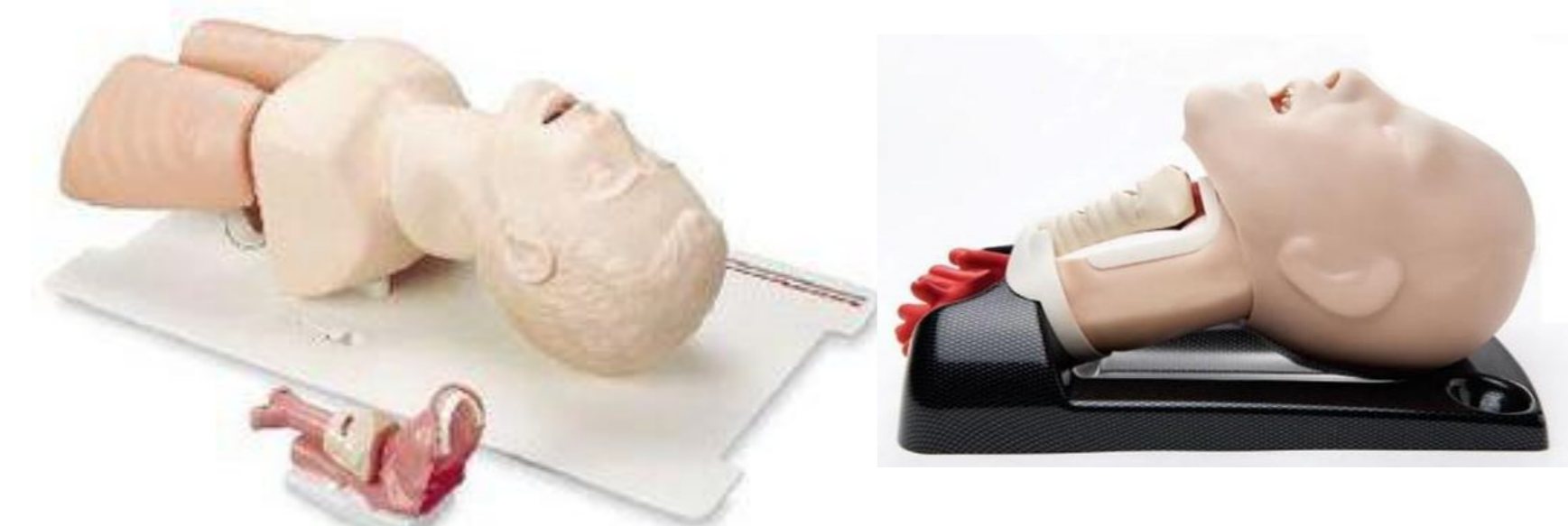
Figura 3 – Manequim de intubação traqueal e de cricotireoidostomia

Fonte: http://brazil.eworldpoint.com/Vias-Aereas