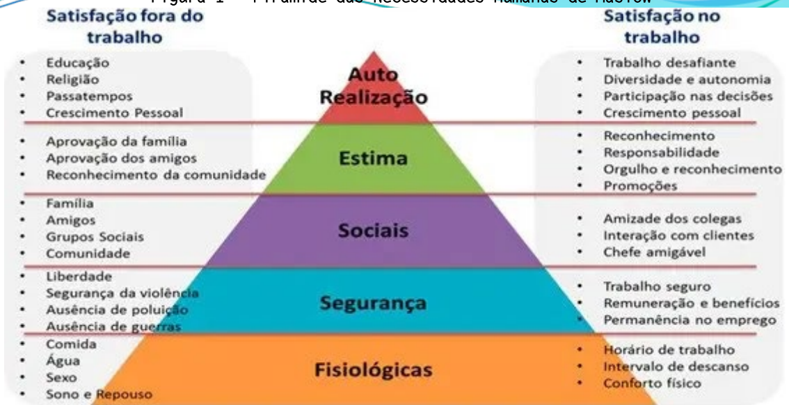
Figura 1 - Pirâmide das Necessidades Humanas de Maslow