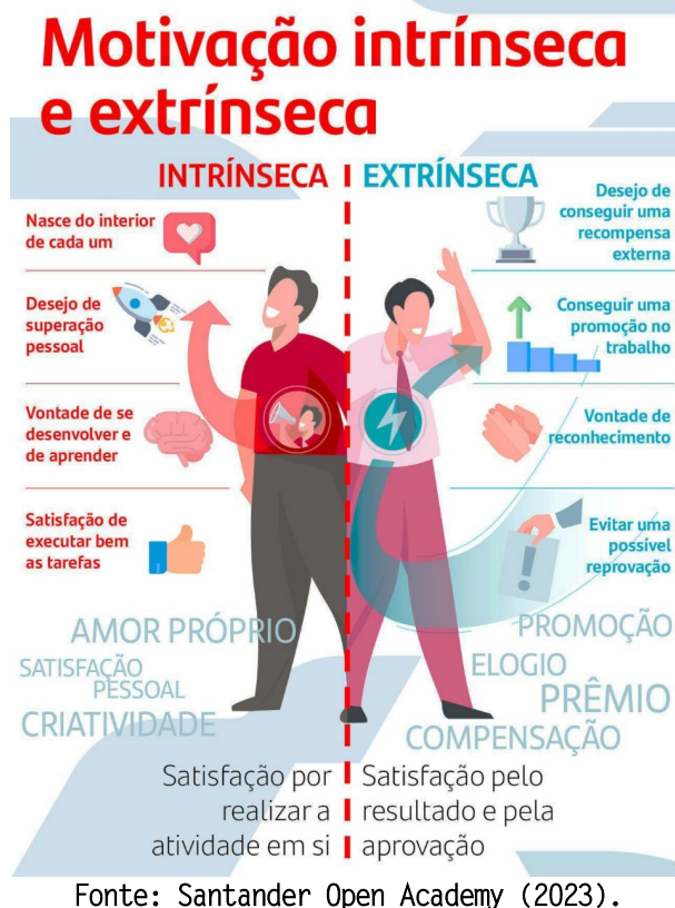
Figura 2 - Diferenças entre Motivação Intrínseca e Extrínseca.